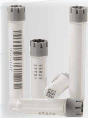
▲ 除2D條碼，也有1D條碼喔！

要完整保存樣品，則保存樣品的容器就十分重要。保存的容器要注意的除了密封度，容器材質也是十分重要的，且當樣品從保存庫中拿出時，溫度急遽變化容易造成容器與蓋子之間不合或容器熱漲冷縮後容易龜裂等等。由上述種種因素可知，若要完整保存樣品則保存容器的品質是關鍵因素。